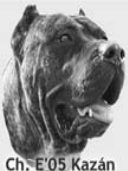
Ch. E'05 Kazán

Cría y selección del Dogo Canario y Gos d'Atura Català