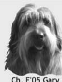
Ch. E'05 Gary

Vicente Gascó Móvil: 629 070 084 E-mail: info@canmuc.com Web: www.canmuc.com